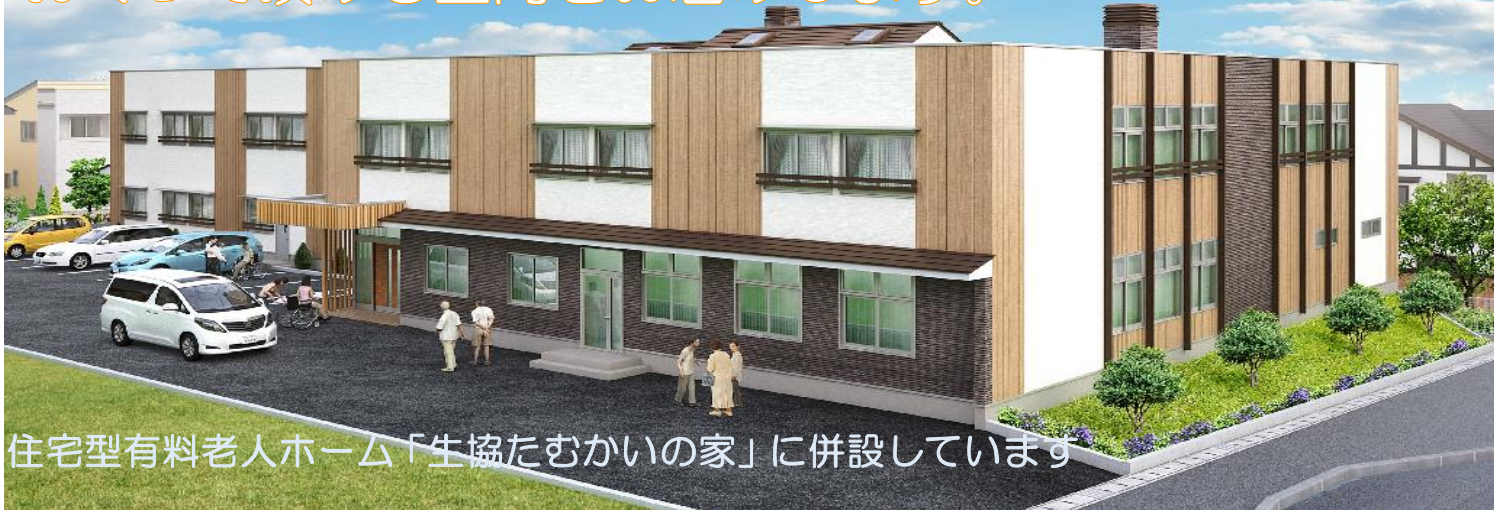
住宅型有料老人ホーム「生協たむかいの家」に併設しています