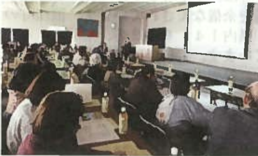
部屋数は40室とし、入

居費を生活保護受給者も入れるよう月額10万円以内に抑える。(介護保険の利用料を除く) ・「困ったときはおたがいさま」の協同組合の心で「みんなでつくる住宅型有料老人ホーム」として広く増資運動への協力をよびかけていきたい。 ・出資金の多い少ないで入居者を決めることはしない。認定委員会(仮称)の決定に委ねる。 ・理事会の中に建設委員会を設置し、更にその下に建設、人材確保養成、活動方針、経営の4つのチームで分担して検討を続けている。