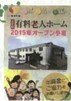
※出資金は寄付金ではありません。

青森県高齢者運動連絡会から年金引き下げについて「不服審査請求」運動への賛同の呼びかけがきました。年金受給者は誰でも参加できます。問い合わせは本部(71-3456・内田)まで。