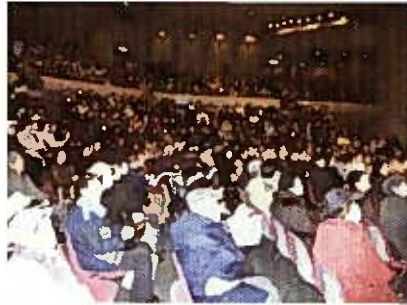
満席の市公民館ホール

(2)創立20周年と「いのちの大運動」を結び付けて取り組んだ「いのちの山河」の上映会(二月十四日、八戸市公民館ホール)は、独自の実行委員会を作り、各支部と職員の奮闘で全国的にも評価される成果で成功させることができました。