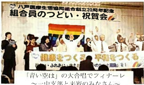
「青い空は」の大合唱でフィナーレ ～一中支部と来賓のみなさん～