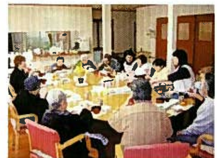
和やかにお話のはずむ小規模多機能ホーム「みなみるいけの家」

(1)二〇〇九年度の最大の出来事は、新型インフルエンザ流行対策のために十月四日開催で準備を進めていた第19回健康まつりを急ぎ中止したことでした。創立以来初めての経験でした。折から取り組んでいた生協強化月間にも少なからぬ影響を与えることになりました。