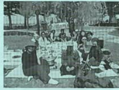
☆あけぼの班(一中支部) 5月9日(木)、三八城公園でお花見会。満開のシダレ桜の下で楽しく交流しました。20名参加。