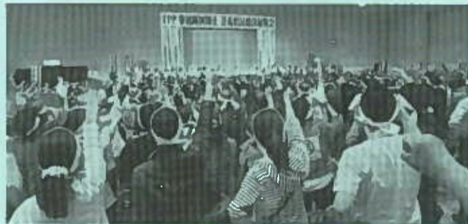
3000名の熱気に包まれたTPP阻止県民集会(青森産業会館)

知事、自民党を除く県選出国会議員、県議会議員のみなさんも参加しました。参議院選挙を前に県民のいのちと暮らしを守るうとの意気込みの伝わるかつてない大きな集会となりました。