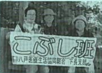
☆こぶし班(下長支部) 5月23日(木)、新班結成南部山ウオーキングを4名で飾りました。