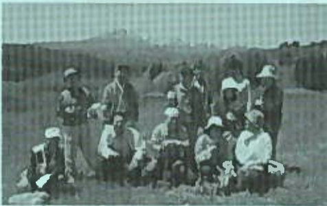
☆上長支部 5月26日(日)、新郷村の山あそぶ山荘で数年ぶりの支部総会。わらび摘み、診療所看護師による「骨粗鬆症」、理事長の医療生協のお話と勉強も盛り沢山。帰途は新郷温泉でくつろぎました。8名の参加者でした。