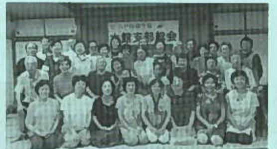
☆大館支部 6月16日(日)、洋野町アグリパークおおさわで支部総会。40名参加。終わって温泉入浴、理事長の「高齢者住宅建設」のお話、ランチタイム、午後は自由時間でくつろぎました。