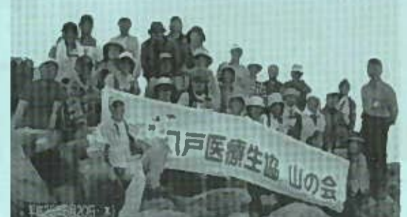
☆山の会 6月20日(木)、姫神山登山。31名全員頂上(1124m)で記念撮影。初めて城内登山口から登り、一本杉コースを下山しました。