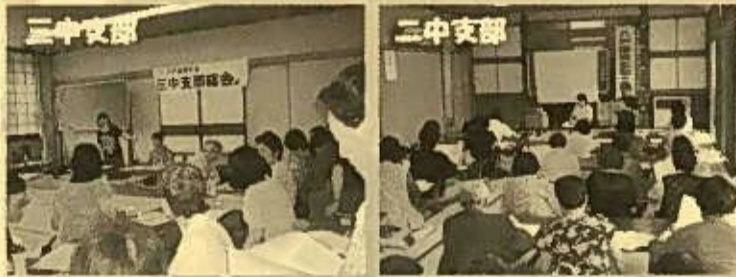
※組合員さんの文芸は都合により今回はお休みとさせていただきます。

8月末までに下長、長者、二中、小中野、三中、白銀支部で開催されました。総会では創立20周年を迎える医療生協の支部活動の方針を話し合った後、和やかに交流しました。